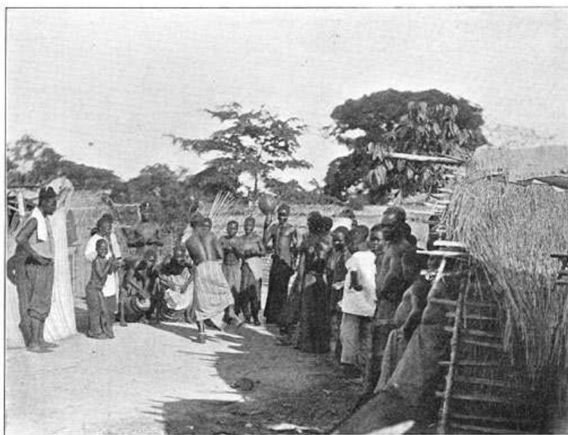
Balali-dorp. Een negerdans.

wordt”,—men behoeft niet lang aan den Congo te vertoeven om het antwoord op deze vragen te vinden. De groote hinderpaal n.l., die een goede ontwikkeling van Midden-Afrika in alle opzichten in den weg staat, is het ongezonde klimaat dezer streken. De koorts, opgewekt door de uitwasemingen der vele moerassen of overgebracht door de muskieten, de stoornissen in de spijsverteringsorganen en de aandoeningen van lever en milt, waaraan de blanke hier blootstaat, zijn de hoofdoorzaken, die den Congo, en niet ten onrechte, om zijn klimaat berucht maken. Hoewel er ook in dit opzicht veel overdreven wordt, blijft het een uitgemaakte zaak, dat de vele ziektegevallen dikwijls met doodelijken afloop, die onder de blanke bevolking voorkomen, kolonisatie, of ook maar een eenigszins geregelde, meer duurzame vestiging beletten. Het ongunstige klimaat, veel meer dan de groote hitte—hoewel deze ook niet voorbij te zien is, waar reeds te 7 uur in den morgen, een uur na zonsopgang dus, de thermometer 80° aanwijst—maakt, dat de blanke het land, al heeft dit ook zeker zijn bekoring, blijft beschouwen als een tijdelijke verblijfplaats, die hij, zoodra de omstandigheden hem dit veroorloven, gaarne tegen de vroeger bewoonde oorden verwisselt.