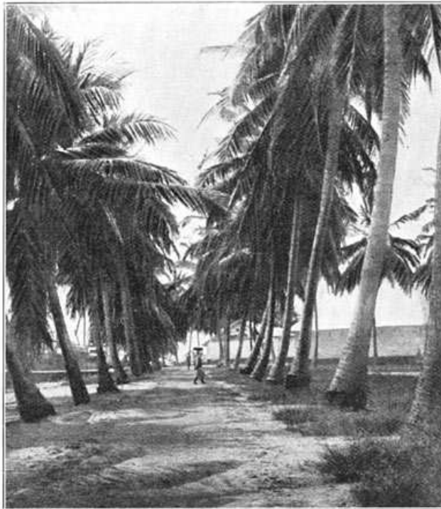
Factorijlaan te Banana.

vooral bij den zoogenaamden Duivelshoek nauwkeurige kennis van den stroom. Deze Duivelshoek is een zeer scherpe bocht in de rivier, juist beneden Matadi, waar het water met geweldige vaart om den sterk vooruitspringenden rotswand heenschiet. Onder het uitvoeren van den bijna rechten hoek, dien ons vaartuig hier moet beschrijven, dringt de stroom het met angstwekkende snelheid en onder sterk overhellen, dwarsover de rivier, op den tegenoverliggenden oever aan; het minste defect aan machine of stuurtoestel zou hier zeker noodlottig worden. Een zucht van verlichting gaat meestal op bij hen die hier bekend zijn, als men, na deze gevaarlijke plaats gepasseerd te zijn, Matadi voor zich ziet.