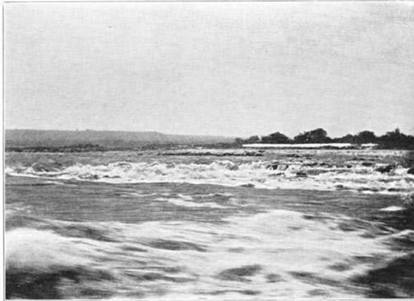
Cataracten in den Congo tusschen Matadi en Stanley-Pool.

Het is te begrijpen, dat de spoor een grooten omkeer te weeg bracht in het transport van reizigers en goederen, 't welk vroeger uitsluitend per karavaan plaats had. Toch moet men ook hier zijne eischen niet te hoog stellen.