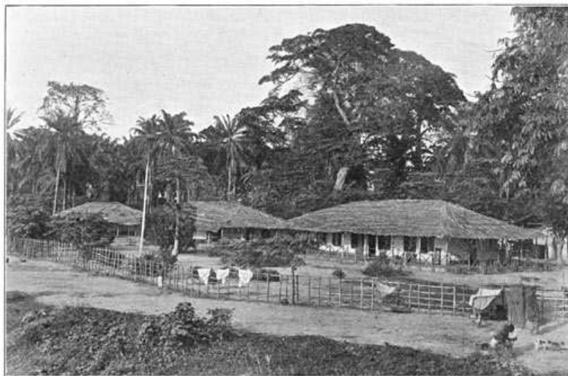
Handels-factorij langs den Boven-Congo.

Ook de aanwezigheid der hutten van de honderden zwarten, die er altijd in dienst waren, liet in dit opzicht niets te wenschen. Op verschillende punten der factorij woonden deze zwarte werklieden, eenigszins van de hoofdwegen af, in afzonderlijke dorpen als 't ware, bijeen. Men vond daar de tamelijk goed gebouwde hutten der Sierra Leona's en Accra's, inboorlingen uit de Engelsche bezittingen aan de kust, die zich hier verhuurden als timmerlieden en metselaars. Ze zijn, over 't algemeen, vooral eerstgenoemden, flinke werklui; spreken goed Engelsch, kunnen meerendeels lezen en schrijven, ontvangen zelfs de in hun vaderland verschijnende couranten per post en zijn bijna zonder uitzondering trotsch op het feit, dat zij bewoners zijn van een Engelsche kolonie en deel uitmaken van het, in hunne schatting, nagenoeg alles omvattende Engelsche rijk. Ook van de kust afkomstig zijn de Whyboys, die reeds in hunne armelijke hutten hunne mindere ontwikkeling toonen. Onder gezag van een headman komen zij, in gezelschappen van 30–60, uit Liberia. Zij zijn zeer gehecht aan hun vaderland en hun blijdschap kent geen grenzen, wanneer zij, na volbrachten diensttijd zich weer naar hun geboorteplaats mogen inschepen. Zij spreken wat gebroken Engelsch en worden in dienst genomen voor allerlei werk aan bootenbouw en in magazijnen, waarvoor zij door hunne groote lichaamskracht, gewoonlijk bijzonder geschikt zijn.