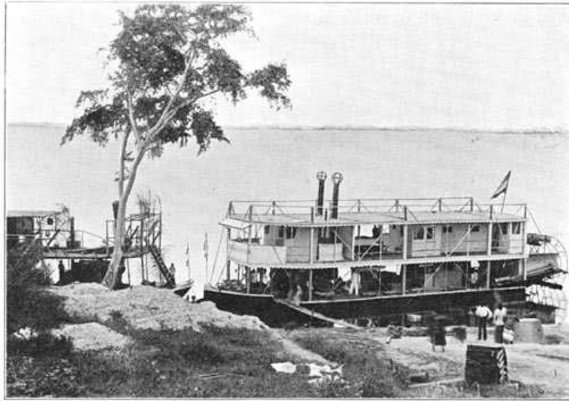
De Koningin Wilhelmina , een der booten van de Ned. Afrikaansche Handelsmaatschappij.

Na zonsondergang is het gaan, zelfs voor hen die hier bekend zijn, en al laat men zich ook vergezellen van een zwarten lantaarndrager, wat trouwens bepaald noodzakelijk is, nog tamelijk gevaarlijk; maar ook over dag waagt bijna niemand zich aan een uitstapje. Van plantengroei is op dezen bodem geen sprake, en wanneer de zon op de naakte steenen brandt is de hitte er haast ondragelijk; men doet hier zijne zaken en blijft overigens zooveel mogelijk onder de beschuttende schaduw zijner veranda.