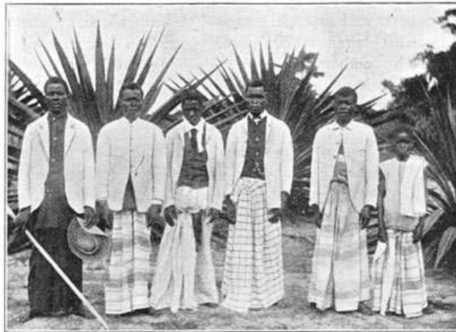
Cabinda's. (Koks, waschlui en tafeljongens).

In den invloed, dien dit groote handelshuis in den Boven-Congo, vooral door de zeldzame energie van zijn begaafden vertegenwoordiger ter plaatse, steeds meer ontwikkelde, zag de Staat een gevaarlijken factor bij de vestiging van zijn gezag, zoodat na een eindelooze reeks van moeilijkheden de Vennootschap haren hoofdzetel voor het binnenland verplaatste naar de overzijde van den Stanley-Pool, naar Brazzaville.